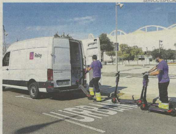
►► Operarios de Novo Rehum descargan unos patinetes de Reby.

Se trata del primer acuerdo de esta naturaleza en los servicios del patinete eléctrico y pone en valor la responsabilidad social de Reby