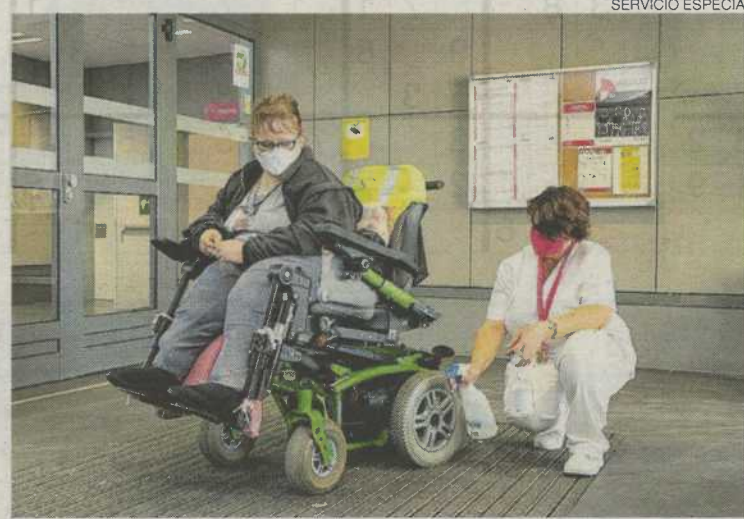
►► Medidas de seguridad en los centros residenciales de DFA.

Este centro se diseñó específicamente con el fin de facilitar la convivencia y la inclusión social, potenciando al máximo la autonomía personal de las personas que ahí viven, favoreciendo su desarrollo y fortaleciendo redes de